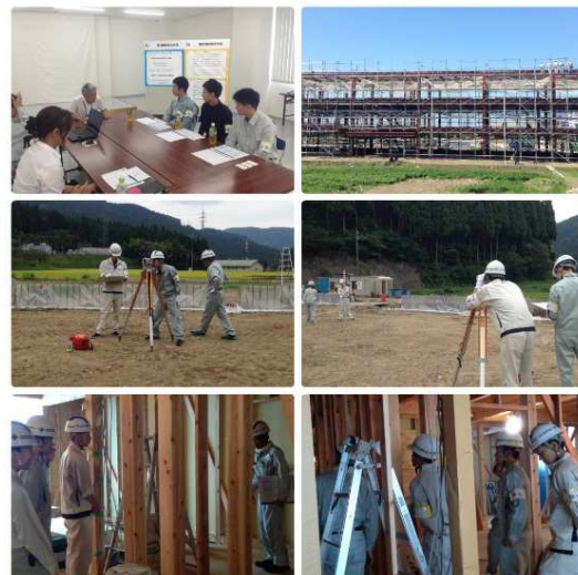
インターンシップ研修