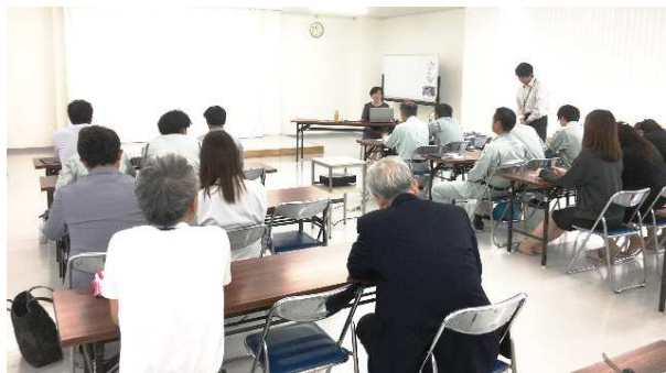
健康に関する研修会