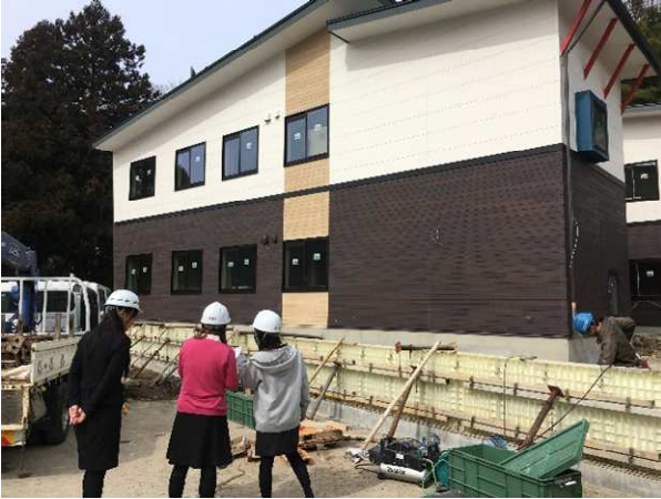
職場環境パトロール