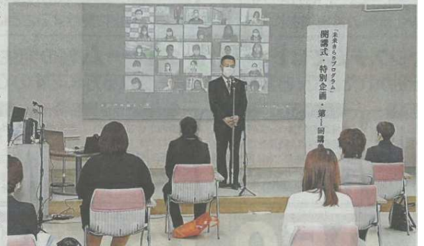
女性リーダーを育成する「未来きらりプログラム」の開講式であいさつする杉本知事＝28日、福井市の県生活学習館

県内企業の女性リーダーを育成する県の研修講座「未来きらりプログラム」の開講式が28日、福井市の県生活学習館で行われた。本年度は40企業・団体の42人が、女性リーダーに必要なビジネスやものづくりのスキルを学ぶ。 県は、お茶の水女子大と連携し、2012年度から研修講座を開いている。昨年度に続き新型コロナウイルスの感染拡大防止のため、リモート参加も可能とした。企業リーダーコースは32人、製造業リーダーコースは10人が受講する。 開講式には、会場とオンラインに分かれて39人が参