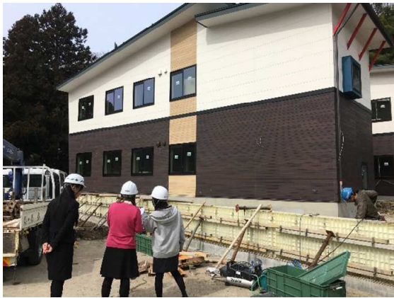
職場環境パトロール