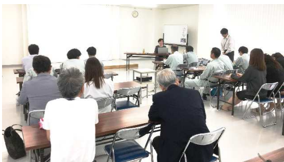
健康に関する研修会