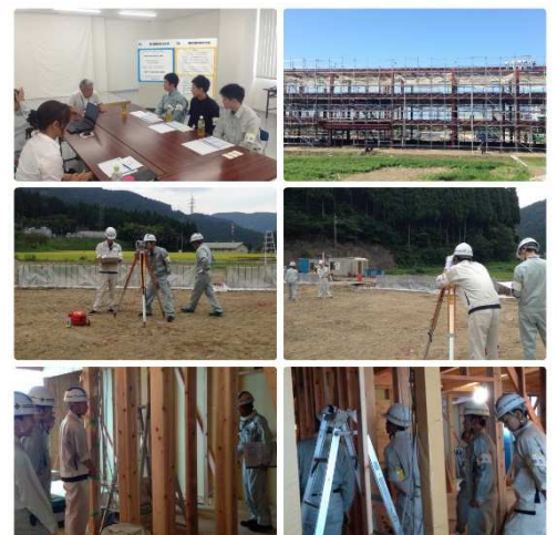
インターンシップ研修